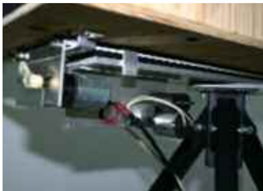
Détail des moteurs montés sur le trépieds pour orientations du rayon laser

Une fois les tests préliminaires en atelier complétés, nous étions prêts à en faire l'essai dans la nature. Jimmy a pris plusieurs après-midis à se promener à divers endroits pour vérifier les