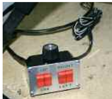
Commutateurs pour les moteurs d'alignement