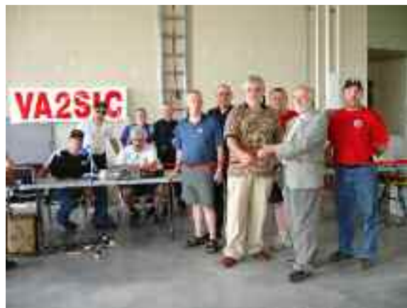
Voici l'inauguration avec les dignitaires.

La nouvelle station radioamateur fut inaugurée le 24 juin 2006 à 12h00 à la caserne au 200, rue Miner à Cowansville. Cette date coïncide avec le concours radioamateur nord américain appelé "Field Day" chapeauté par l'ARRL (Amateur Radio Relay League). Ce