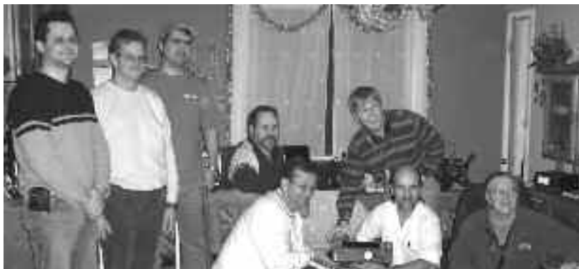
De gauche à droite :VA2BAZ, VA2MAR, VE2CVX, VA2SGL,VE2GHI, VE2LCM, VE2EZD et VA2LM.