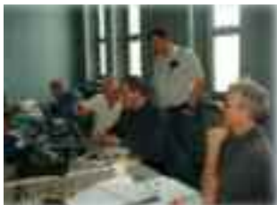
Participants aux ateliers de PIC

Le terme "PIC" signifie Programmable Interrupt Controller. Ce petit circuit intégré est une merveille d'ingéniosité, qui, une fois programmé, peut être utilisé à contrôler pratiquement n'importe quoi, que ce soit un bloc d'alimentation ou un contrôleur sophistiqué de répéteur.