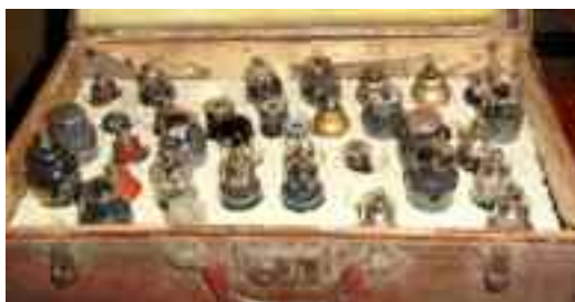
Des valises pleines de lampes

Claude m'a raconté qu'il a la nostalgie des vieilles choses, et qu'il col-